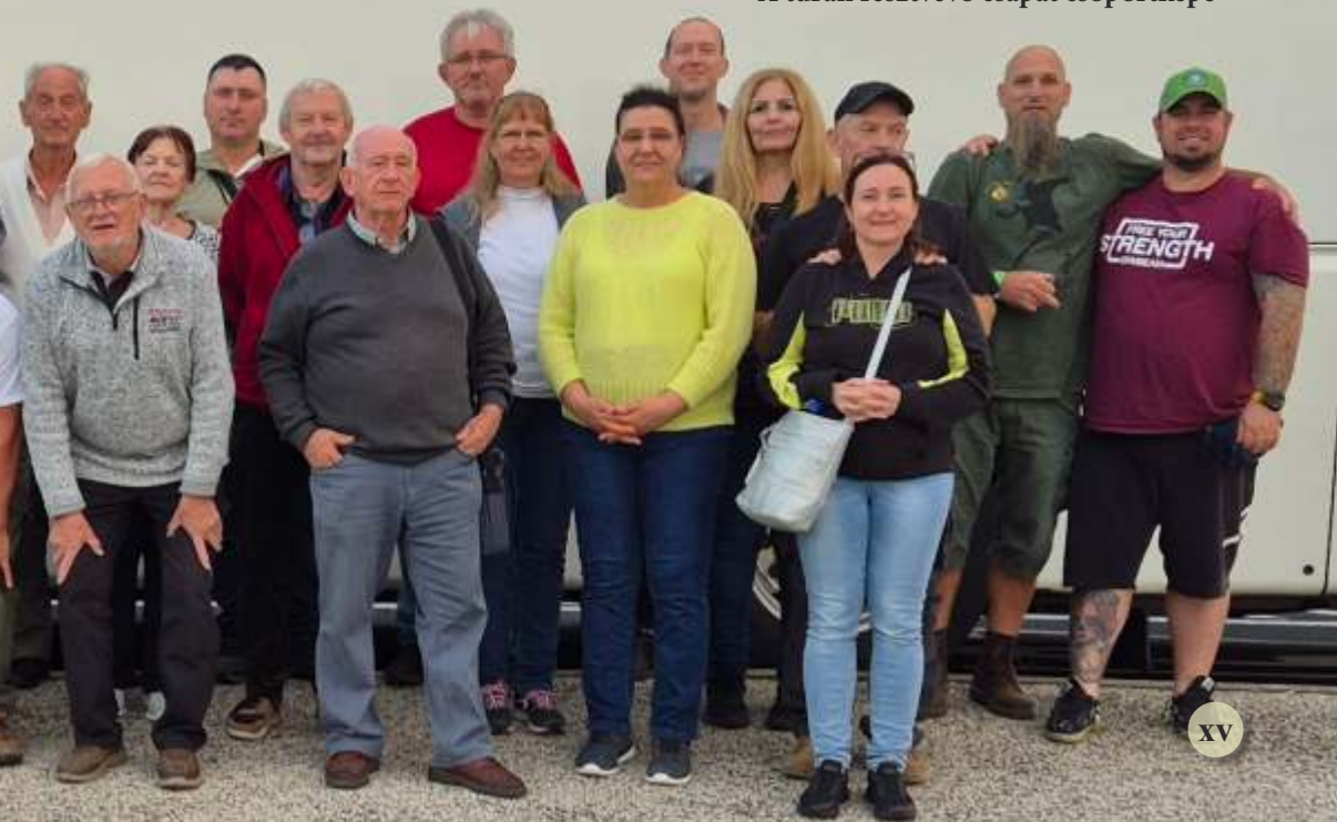
A túrán résztvevő csapat csoportképe