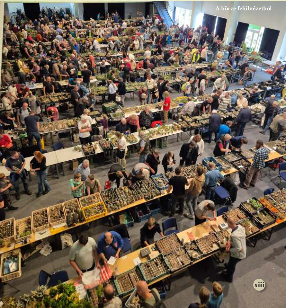
A börze felülnézetből

Este fél 7 körül megérkeztünk a szállásunkra, ami 10 perc sétára volt az IDEON rendezvénycsarnoktól. Ezt akkor realizáltuk, amikor másnap 3-4 perc alatt ott voltunk busszal. Este ki-ki ízlése szerint pizzériát, cseh éttermet és/vagy sörözőt vett célba a nap élményeinek levezetéseként. Amennyire meg tudtam ítélni, nagyon senki nem vitte túlzásba az esti lazítást, mert abban teljes volt az egyetértés, hogy másnap reggel korán akarunk megérkezni, hogy az elsők között tudjunk bemenni a vásárba.